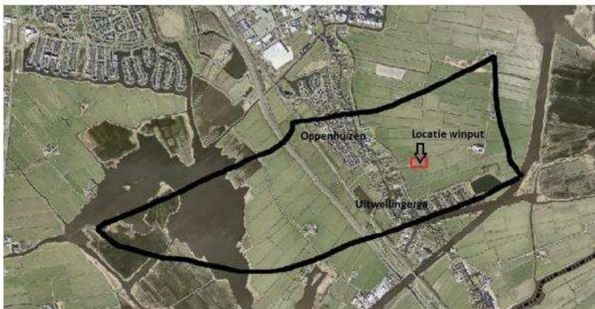
Kaart 2: Globale indicatie ligging Veld Oppenhuizen

In het gebied “Zuid-Friesland III” ligt het veld “Oppenhuizen”